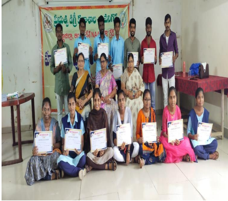
Students with Certificates