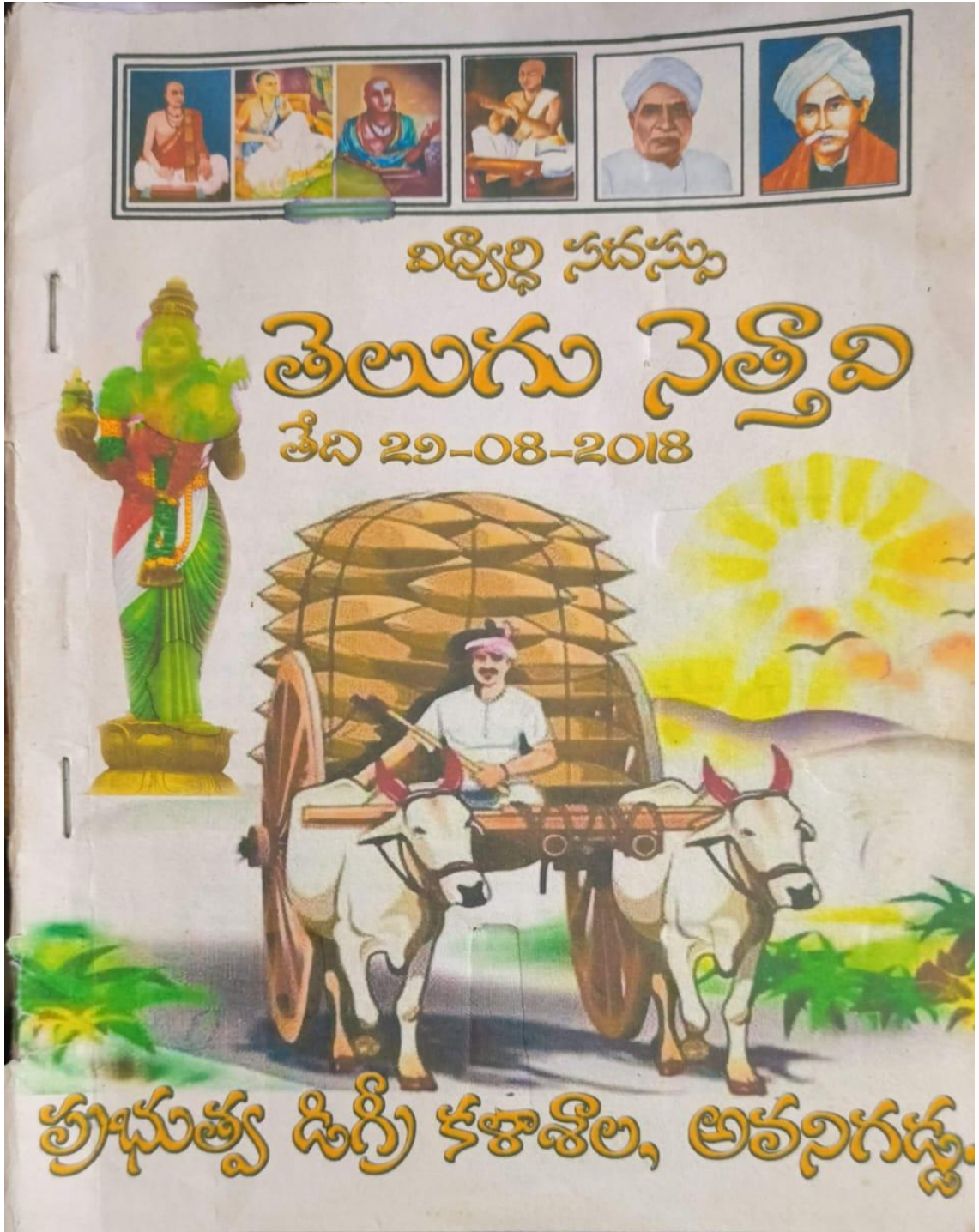
'Telugu Nethavi' book cover page